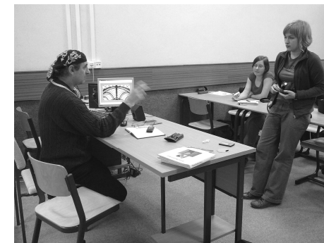
Foto pořízeno při dílně