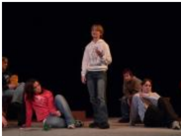
Pouchovští recitují pásmo básní o životě...