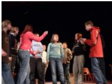
... rozebírají problémy s okolím