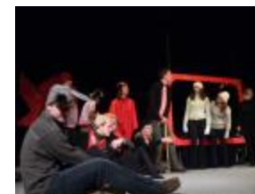
Farma zvířat v přímém přenosu