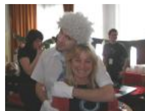
Anděl strážný chrání ředitelku festivalu