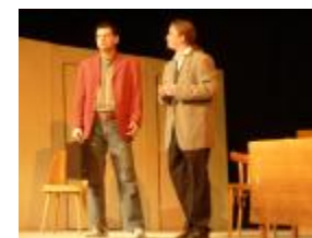
Členové souboru Ambrozia na jevišti