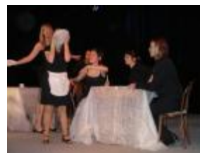
Svatebčané z Obludária u stolu